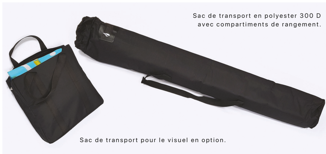
Sac de transport en polyester 300 D avec compartiments de rangement.