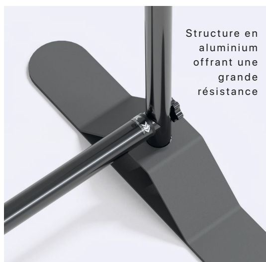
Structure en aluminium offrant une grande résistance