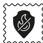
Norme B1 anti-feu