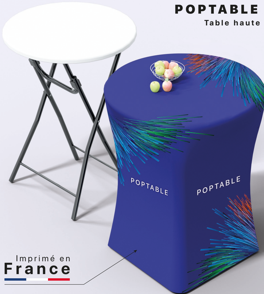
Table haute pliante