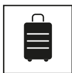
Sac de transport inclus

Nos tables pliantes sont constituées de plateaux en polyéthylène HDPE moulés, scindés en 2 pour faciliter le transport et de pieds en acier avec un revêtement grainé pour une meilleure durabilité. Les pieds se déploient avec la gravité et ont un système de verrouillage anti-repli ainsi que des patins en caoutchouc à leurs extrémités. Les tables se replient en quelques secondes et se transportent facilement avec leurs hanches et leur housse de protection. Capacité de charge : 150kg. Les tables peuvent être livrées sans habillage ou avec habillage personnalisé. Lorsqu'elles sont personnalisées, la housse est imprimée dans l'Oise en sublimation numérique all-over sur une matière Interlock 280g/m 2 très extensible pour épouser au mieux les formes de la table. Des renforts au niveau des pieds sont ajoutés dans l'impression pour garantir la durabilité du print.