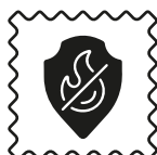
Norme M1 anti-feu